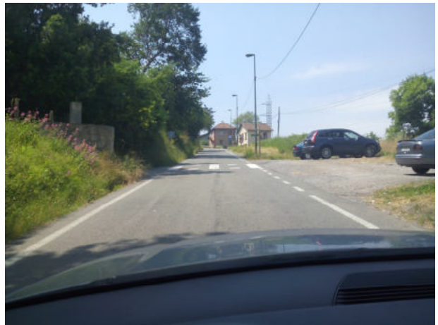
Estamos en Pagasarribidea