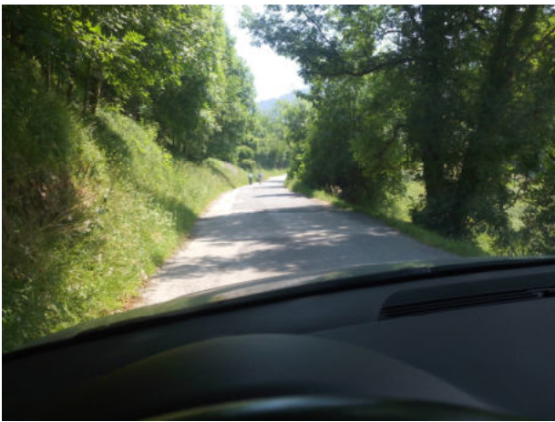
Seguimos por Pagasarribidea