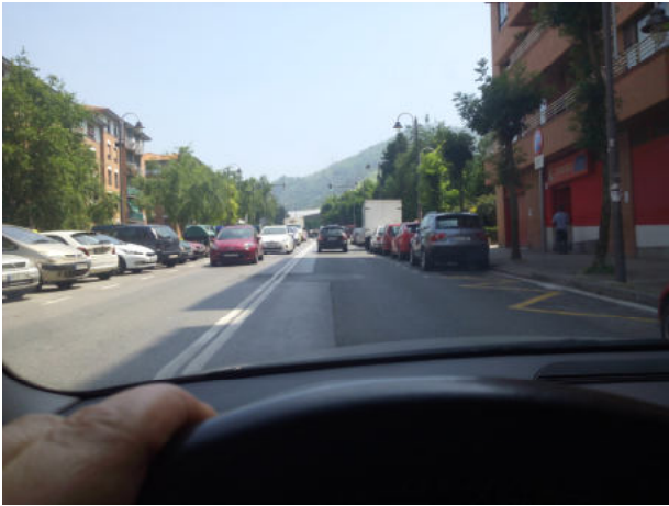
Subimos toda la calle