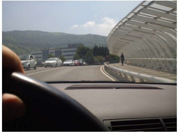
Pasamos por encima de la A8 con Iberdrola al frente (nada más pasar el puente seguimos por la izquierda)