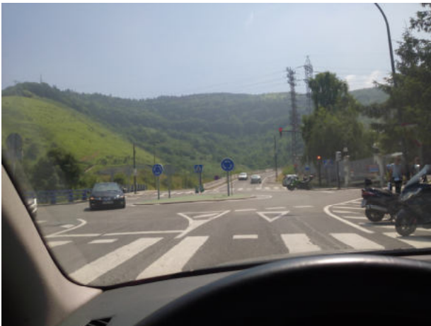
En la rotonda seguimos al frente y empezamos a subir