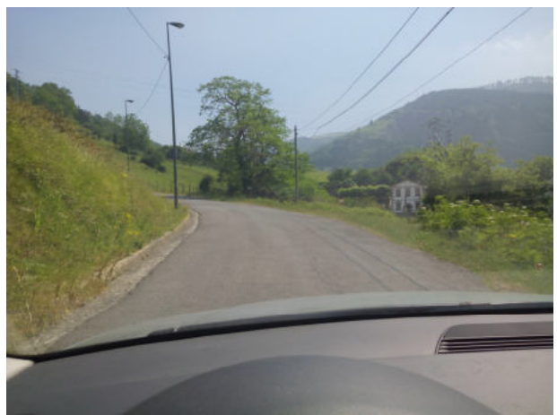
Seguimos en Pagasarribidea