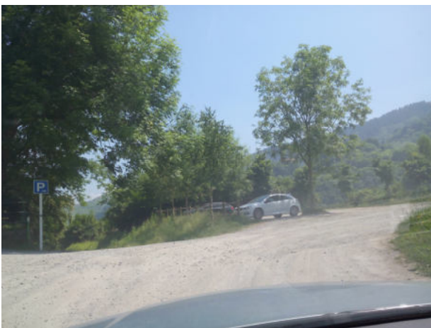
Entrada y parking espacioso, espero que no haya problemas de espacio el domingo.