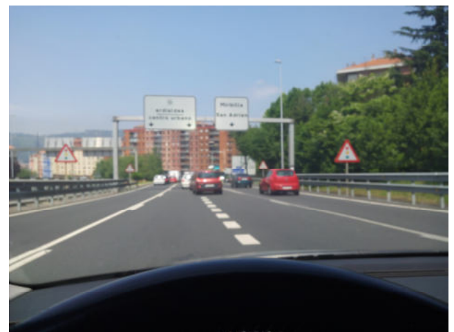
Sin llegar a la rotonda nos colocamos en el carril de la derecha