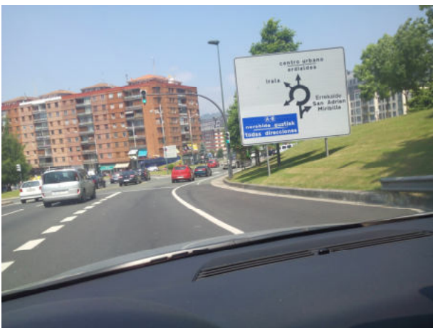
Sin meternos por la rotonda salimos por la salida de la derecha (dirección San Adrián)