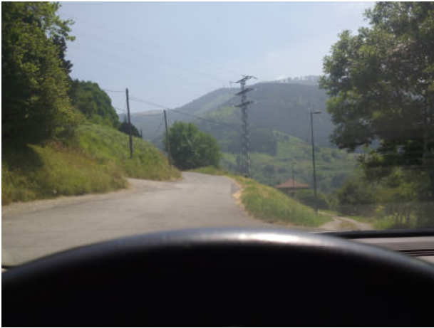
Seguimos por Pagasarribidea y dejamos atrás el bar llamado del "Athletic", tiene un escudo del mismo del tamaño adecuado a uno de Bilbao.