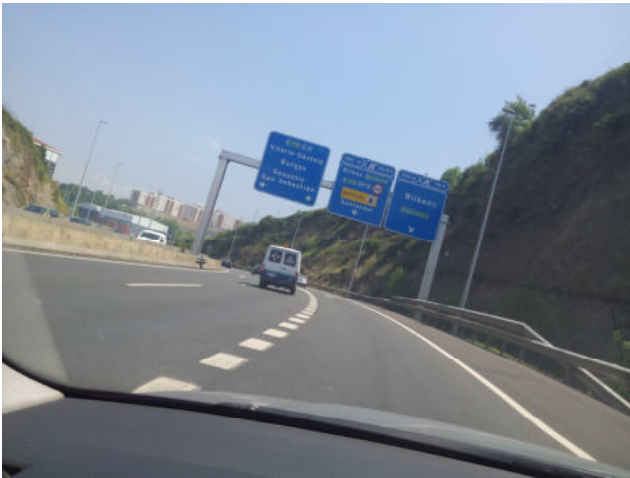
Tomamos la salida de Zabalburu.

Salimos de Algorta con dirección a Bilbao por la Avanzada, Rontegui y la A-8.