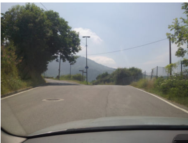
Seguimos siempre por Pagasarribidea y tomamos la carretera de la izquierda