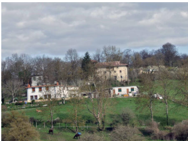
Llegando a Uzkiانو

Comenzamos a caminar desde Oiardo en dirección al núcleo de población cercano de Uzkiانو. Caminaremos por la carretera que hemos dejado con el autobús para entrar en la plaza. Durante el camino la panorámica sobre sierra Salvada es un disfrute para la vista.