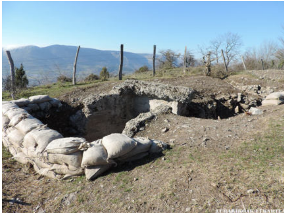
Trincheras en San Pedro de Beratza (Askuren)

A continuación, tomamos el camino de la derecha junto a una trinchera hasta donde termina. Desde ese punto continuaremos por un sendero que sale por la derecha y que nos lleva hasta el camino que transcurre junto al pinar por el que hemos pasado anteriormente.