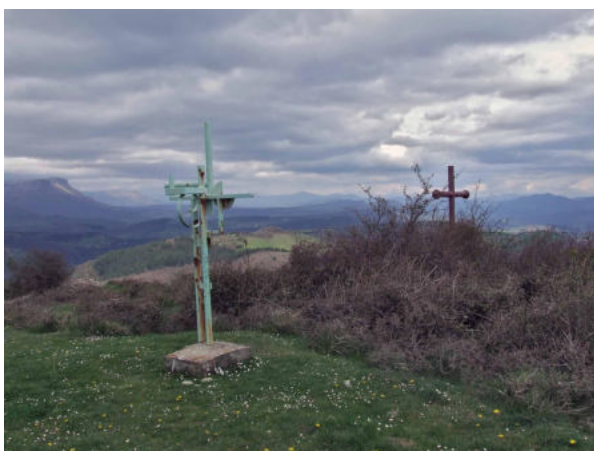
San Pedro de Beratza (Askuren)

Seguimos por la pista hasta toparnos con un cruce en el que tomamos la pista de la derecha. En el siguiente cruce tomaremos el camino que transcurre dejando justo a su izquierda un pinar.