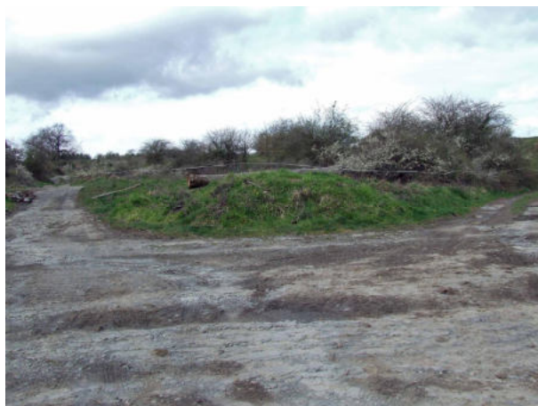
Pista que sale por la derecha

Son poco más de 1,5 kilómetros. Se atraviesa Uzkiانو y se continúa hacia unas viviendas que hay en la parte de abajo. Llegamos a un primer cruce en el que continuamos de frente y al poco rato tras dejar atrás unas naves por la derecha y un caserío a la izquierda tomamos una pista que sale por la derecha.