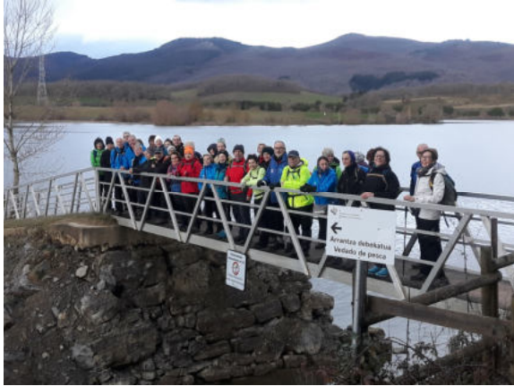
Acceso a la plataforma flotante

Zadorra entra al embalse por la derecha de la plataforma flotante que hemos atravesado. La entrada del río Zadorra en el embalse está catalogada como zona Ramsar (Humedales de Importancia Internacional especialmente como Hábitat de Aves Acuáticas) y destaca su conservada vegetación con sauces, fresnos y chopos, las valiosas comunidades de plantas acuáticas que aquí se desarrollan, además de las diferentes especies de aves que eligen este lugar para alimentarse o reproducirse.