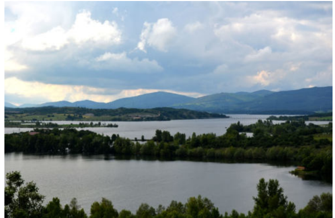
Parque Ornitológico Mendixur

A continuación tomaremos una pista dirección oeste dejando el embalse a nuestra izquierda y observaremos a nuestra derecha el Parque Ornitológico Mendixur ubicado en una de las colas meridionales del embalse que están recogidas en la lista de humedales protegidos por el Convenio Ramsar por su importancia como lugar de alimentación y reposo durante la migración de numerosas aves acuáticas.