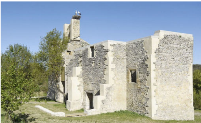
Antigua Iglesia de Garaio

Comenzamos el itinerario desde el aparcamiento que está en la parte baja del montículo donde se encuentran los Baños, el autobús llegará allí después de pasar por la Oficina de Información del parque y la antigua Iglesia de Garaio dedicada a San Esteban.