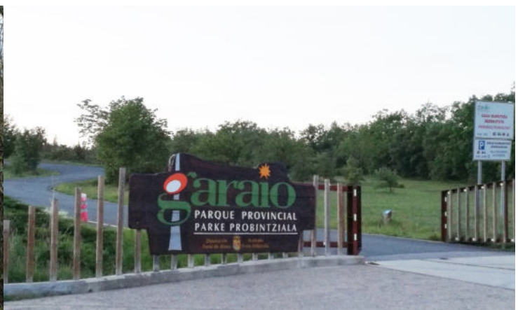
Entrada Parque Garaio