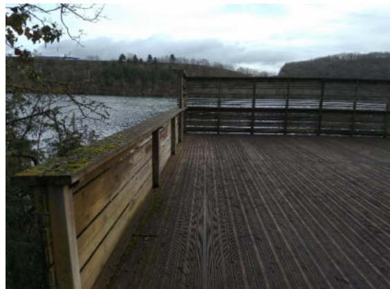
Mirador de Otxanda

Tras bajar del autobús nos dirigiremos hacia la orilla del embalse donde están las “playas” de Garaio Norte y tras llegar a la orilla nos dirigiremos hacia la derecha bordeando el pequeño monte Muskurio donde se encuentra el mirador Otxanda. Si en vez dirigirnos a la orilla del embalse seguimos por la pista llegaríamos al citado mirador. Construido en 2010, el mirador de Otxanda ofrece una vista elevada del río Zadorra a su entrada al embalse y del paisaje montañoso que lo rodea: desde Gorbea hasta Aizkorri, pasando por la sierra de Elgea.