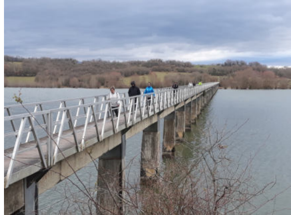
Pasarela de Azua

Posteriormente nos toparemos con un puente de 432m “la pasarela de Azua”, que atravesaremos, si no se cruzase este puente la pista nos llevaría a Marieta. Tras pasar el puente tomaremos la pista de la izquierda, siguiendo nuestro recorrido por orillas del pantano. El camino de la derecha nos llevaría a Nanclares de Gamboa y Ullibarri-Gamboa pueblo, esta opción la tomaron erróneamente un grupo de Itxartu en una salida anterior por la zona.