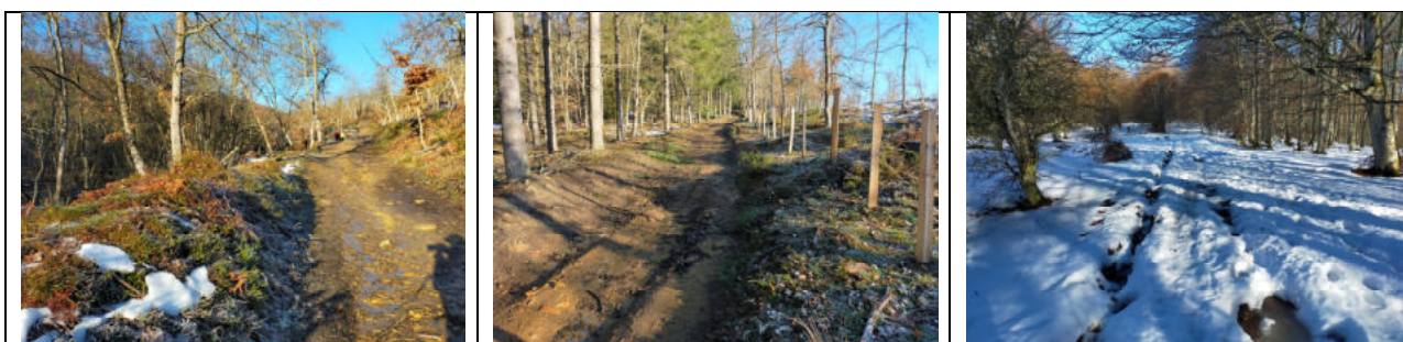
Estado de la pista a medida que se asciende

El día que preparamos la ruta (03-02-2023) nos topamos con hielo y nieve a medida que íbamos ascendiendo. En algunas zonas tuvimos que andar con cuidado para no resbalar en el hielo, lo solventamos andando por las zonas de la pista con nieve no pisada.