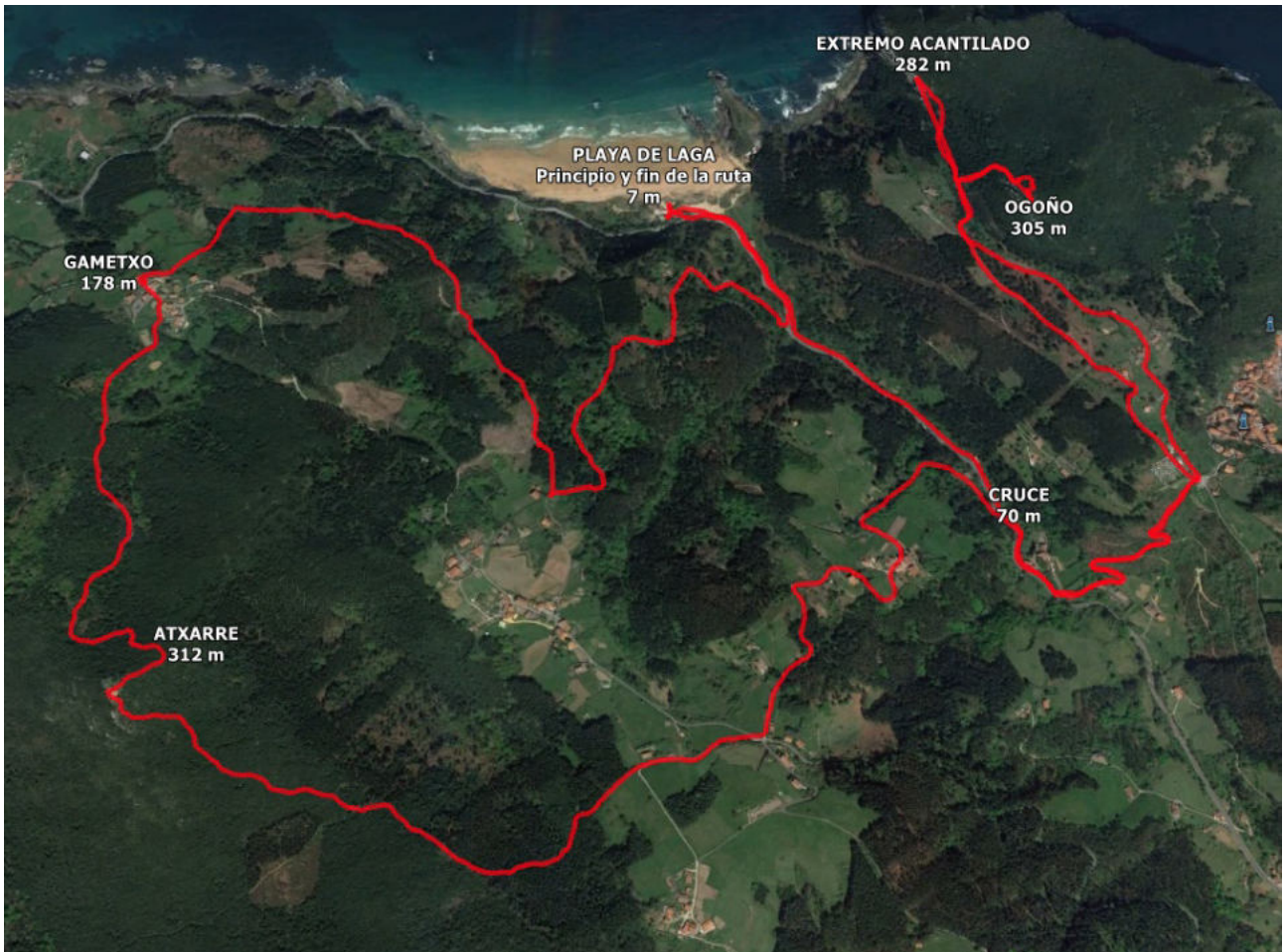
Itxartu Mendigoizale Taldea, marzo de 2023