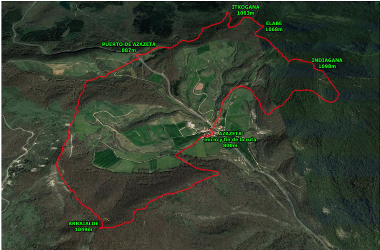
Itxartu Mendigoizale Taldea, junio de 2023