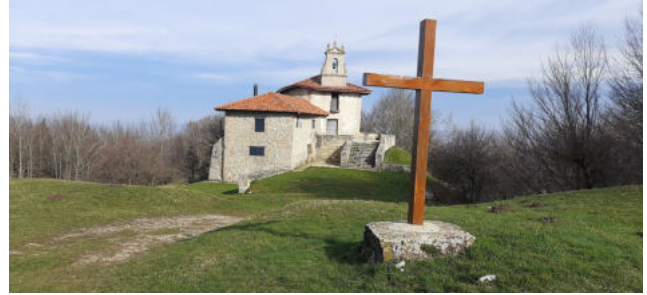
Ermita de San Bitor

Continuamos en una fuerte bajada pasamos la charca y seguimos de frente hasta la valla que hay a la izquierda. La cruzamos y bajamos por un hayedo, dirección al alto del puerto de Azazeta, cruzamos la carretera y por una pista, llegamos a la ermita de San Bitor.