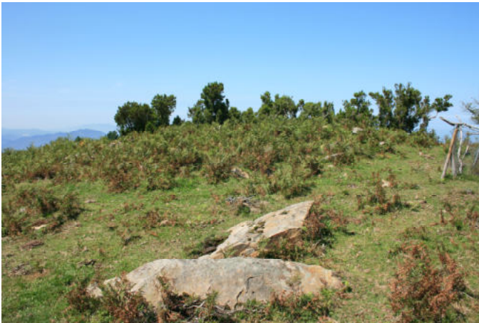
Dolmen de Ganeran

El Ganeran situado en Galdames, la cima más destacada de la sierra de Triano-Grumeran. Esta cordillera se compone de montañas de unos 800 metros de longitud que separan Bilbao del norte y las Encartaciones del sur. La minería ha sido la principal actividad económica de esta zona durante varias generaciones y todavía hoy encontraremos diversos testimonios de esta actividad en los montes, valles y pueblos de la zona de Ganeran, sobre todo en La Arboleda - La Arboleda.