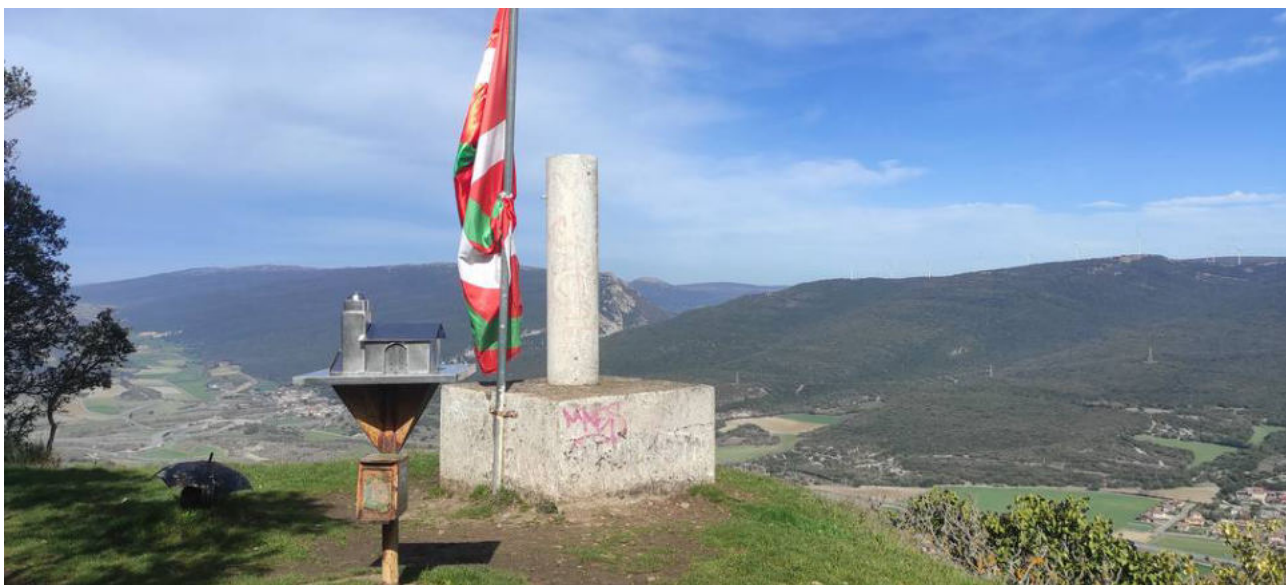
San Vitores (895m)

Tiene una morfología muy común en el territorio occidental de Álava, con una vertiente suave (en este caso Sur) en contraposición a las paredes rocosas de la vertiente opuesta (Norte).