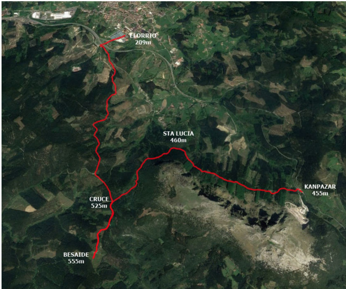
Itxartu Mendigoizale Taldea, septiembre de 2024